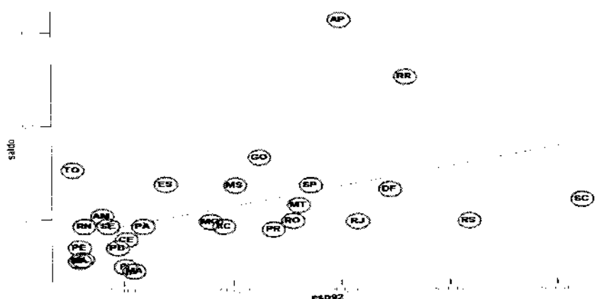
Gráfico 1 Saldo Migratório sobre População e Esperança de Renda Resultado da Regressão: Saldo = -2,44E(-2) + 1,04E(-5)* ESP92; R(2) = 0,2 F = 6,2 D - W = 1,49 (-1,9)* (2,5)

* Significativo a 5%.